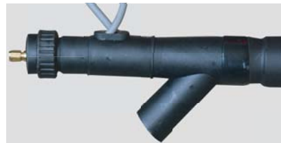
Breukbeschermsstuk met draaibare aansluiting