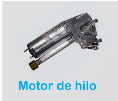
Motor de hilo